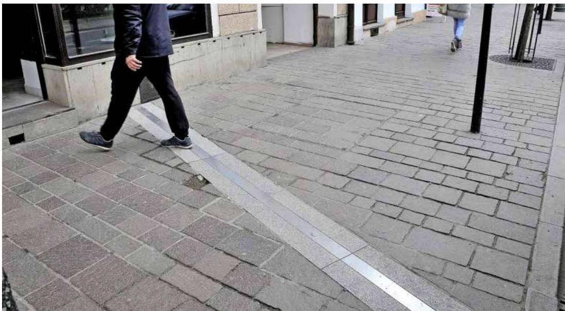
Ravnobežku pripomína aj lišta na chodníku.