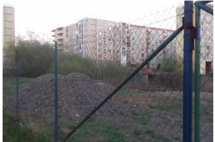
Priestor je v pôvodnom stave.

dokladoval povolenia pre túto činnosť. „Zároveň spoločnosť vyzval aby, odstránila navezený štrk zo spevnených plôch a verejného priestranstva mesta, odstránila znečistenie miestnych komunikácií v priestore staveniska. Tiež sme ich požiadali, aby nevykonávali ďalšie práce na pozemkoch vo vlastníctve bratislavskej spoločnosti v priestore staveniska a ihneď zastavili navážanie zeminy so staveb-