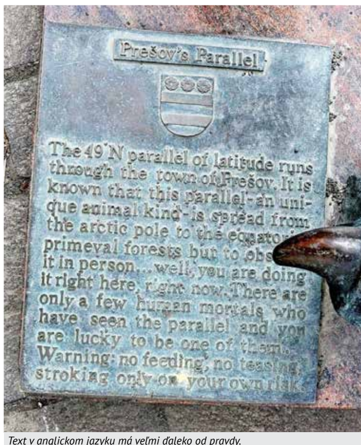
Text v anglickom jazyku má veľmi ďaleko od pravdy.