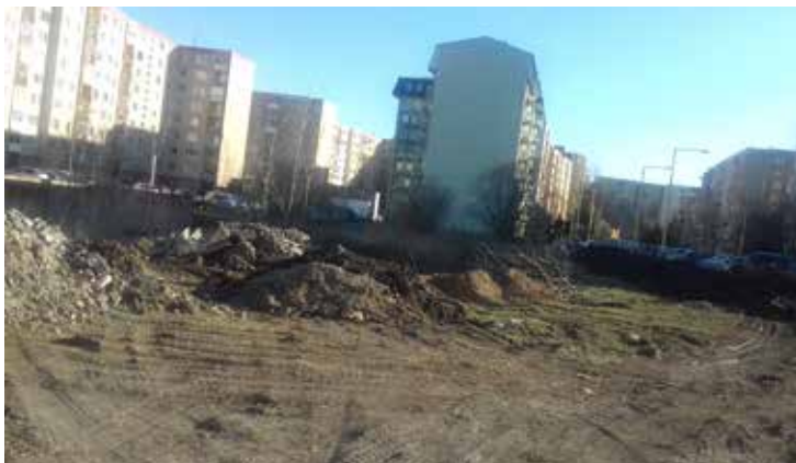
Takto to vyzeralo, keď tu prešovská spoločnosť vyvážala stavebný odpad.