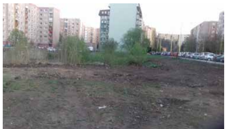
A takto to vyzerá po tom, ako sme na problém upozornili.

Máte problém a neviete si s ním rady? Zažili ste situáciu, o ktorej by mali vedieť aj ostatní čitatelia? Napište nám!